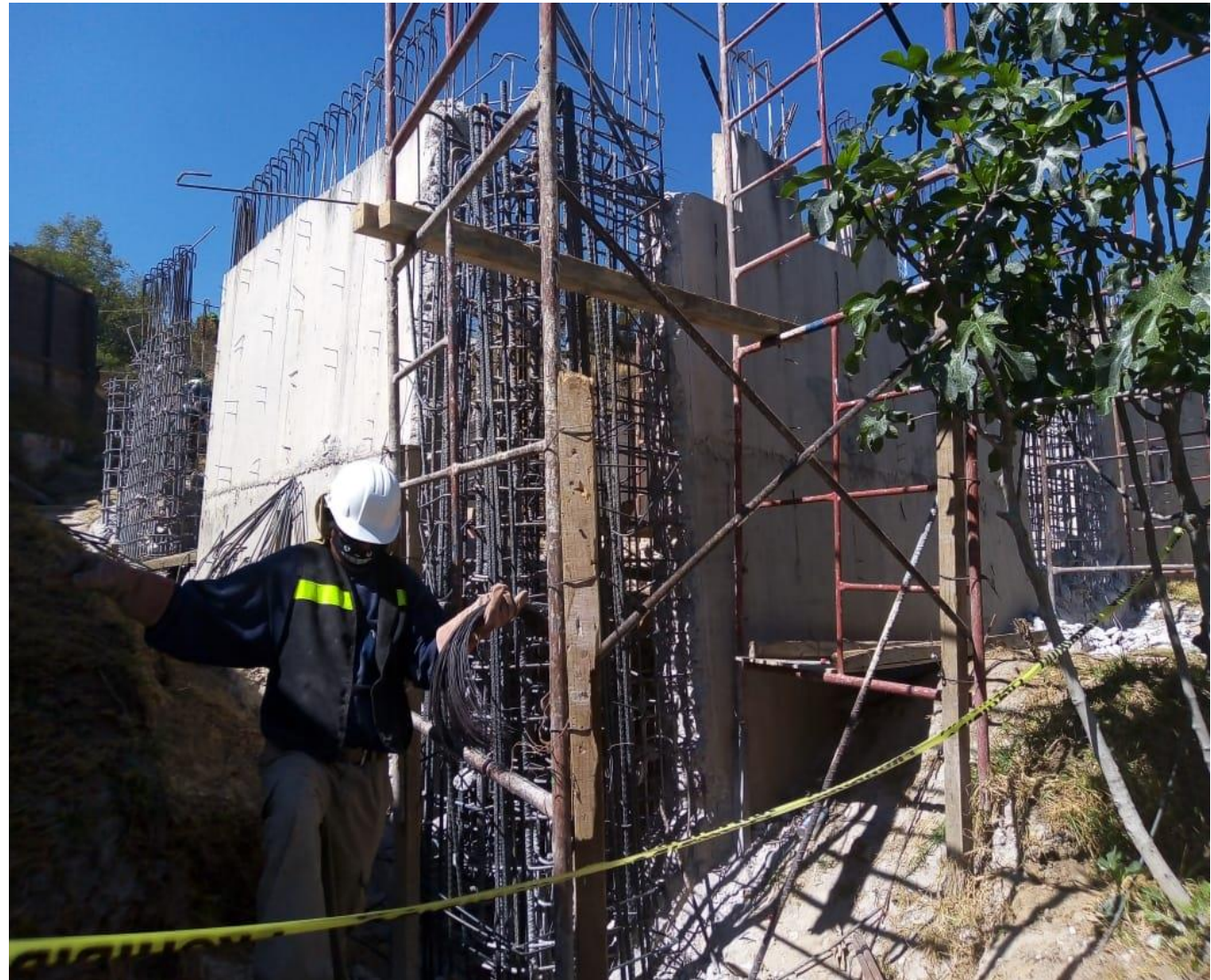
Reforzamiento de la cimentación