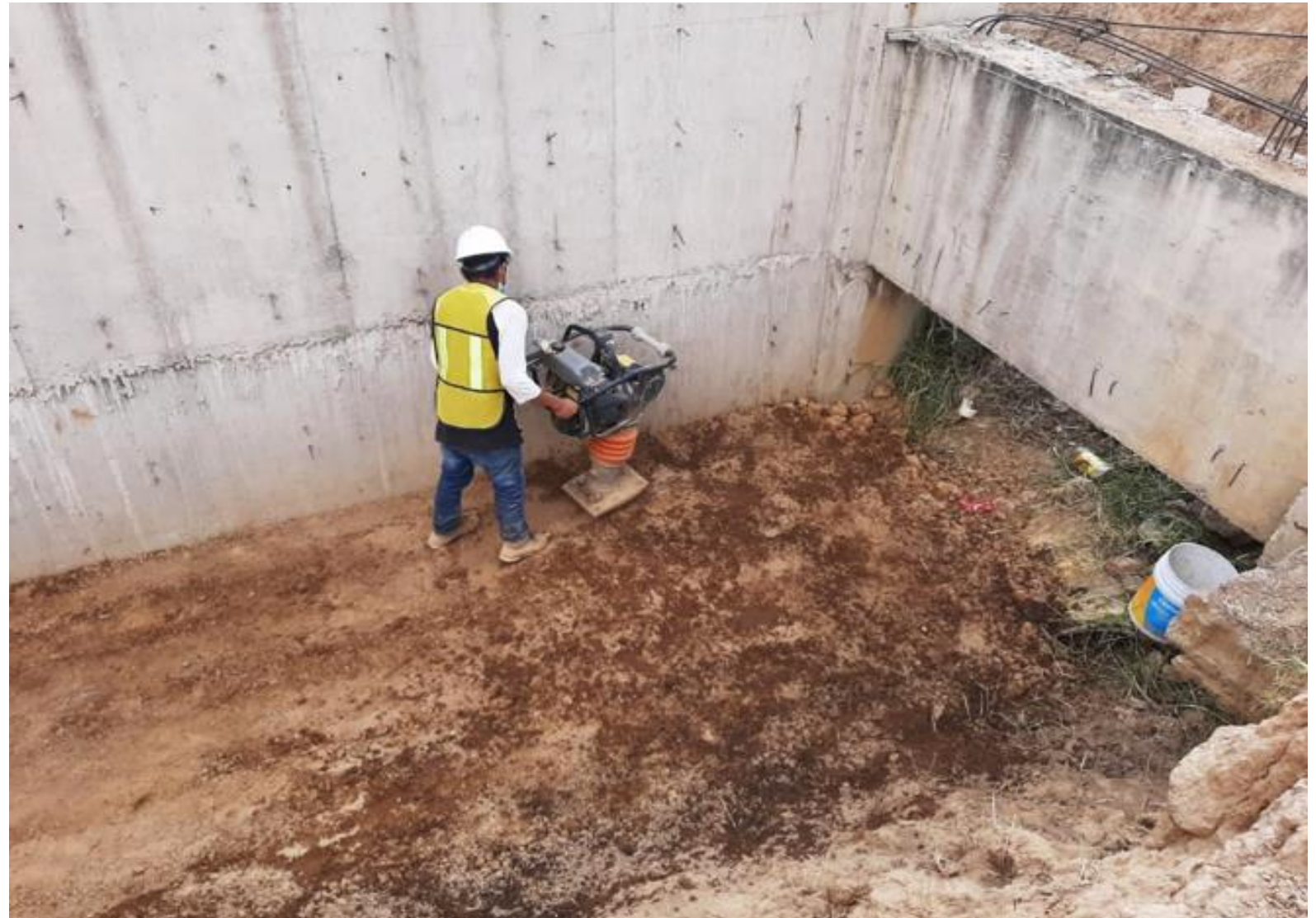
Mejoramiento del terreno