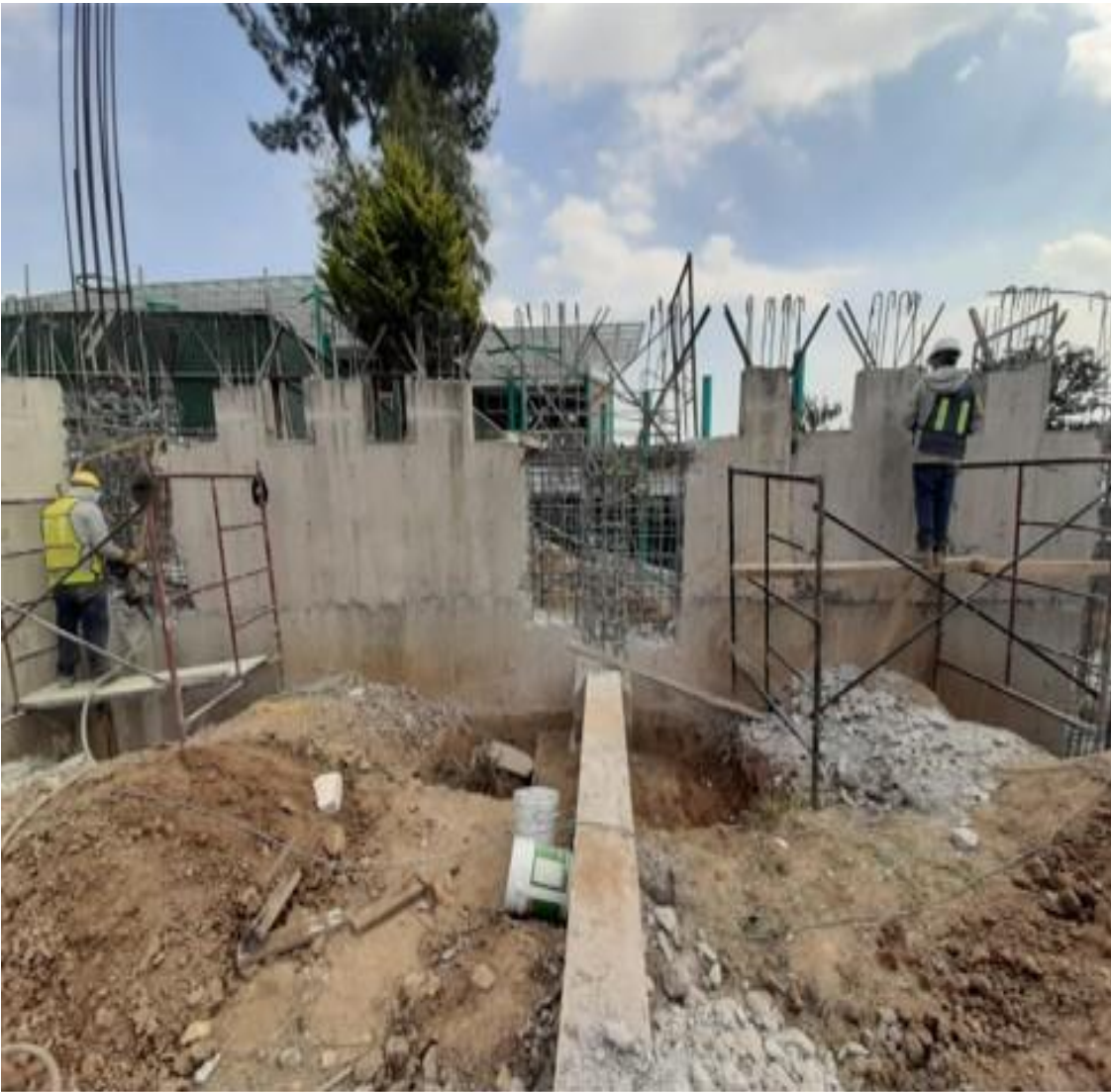
Preparaciones para el los trabajos de cimentación