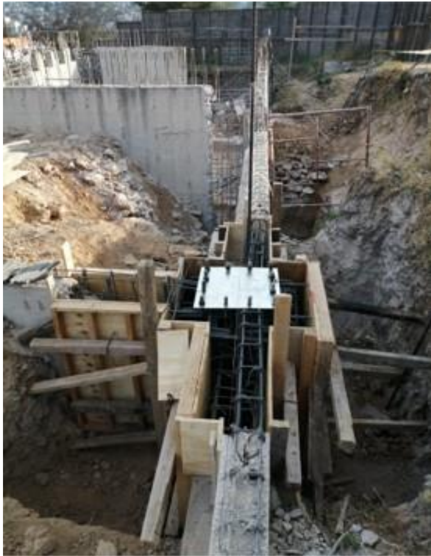
Ampliación de zapatas de cimentación