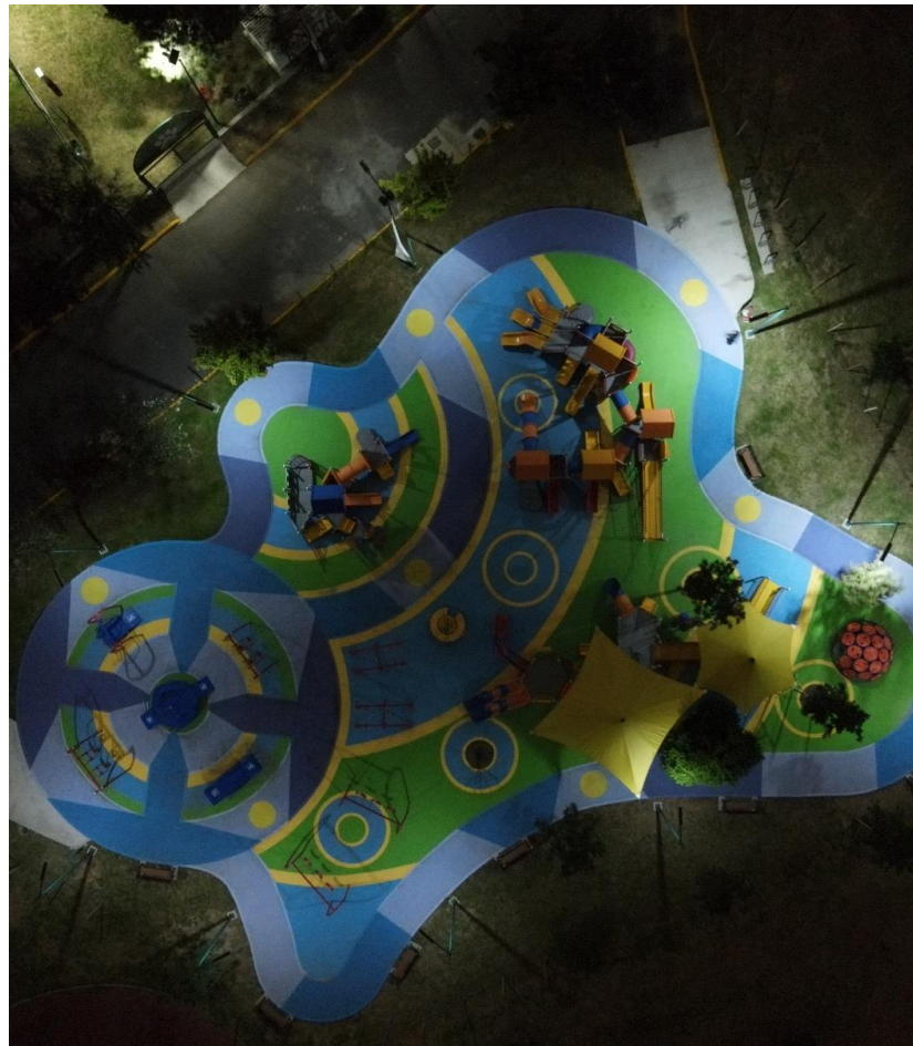
ÁREA RECREATIVA INCLUYENTE