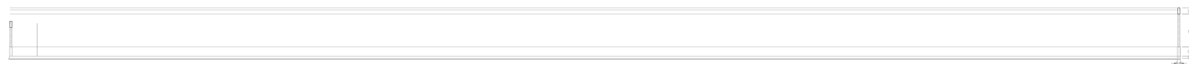
PERFIL DE CIMENTACION